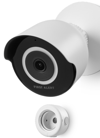
CAMWE-WOBB (Opcional) Utilice la caja posterior para ocultar cables y conexiones

Para una instalación rápida y confiable, la cámara soporta conectividad de red WiFi y Ethernet, y si la conexión cableada no está funcionando, el WiFi se activa automáticamente permitiendo que la grabación continúe. Además, puede alimentarse a través de Ethernet (PoE) o de la red eléctrica. La caja posterior opcional facilita el montaje de la cámara al mantener los cables seguros y ocultos, y su elegante diseño se acopla a la estética del hogar.